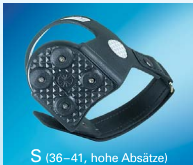
S (36-41, hohe Absätze)

Passt an fast alle Schuhe. Vier verschiedene Größen.